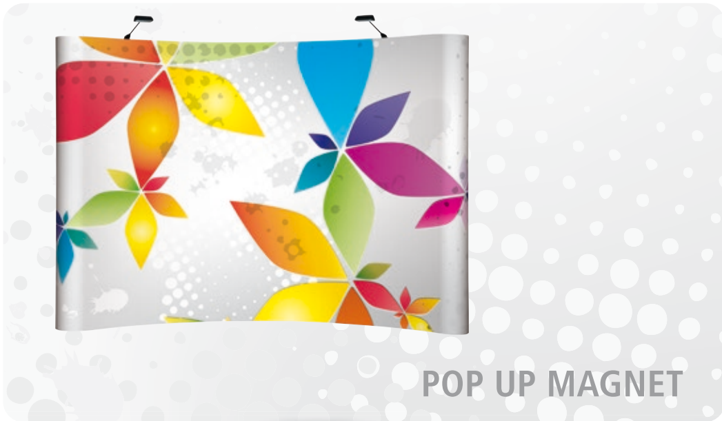
POP UP MAGNET