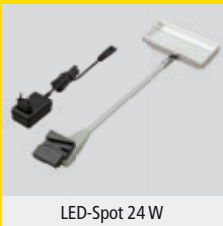
LED-Spot 24 W