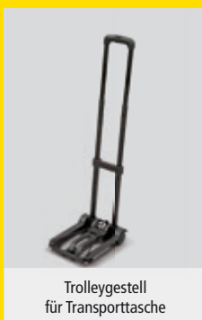
Trolleygestell für Transporttasche