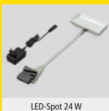
LED-Spot 24 W