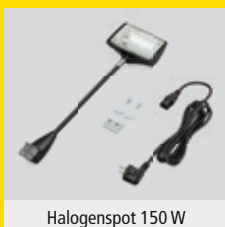
Halogenspot 150 W