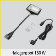
Halogenspot 150 W