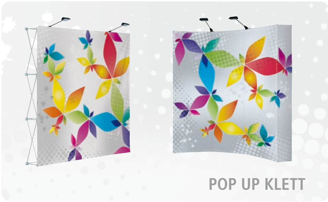
POP UP KLETT